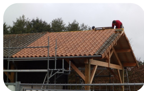
Agrandissement du préau