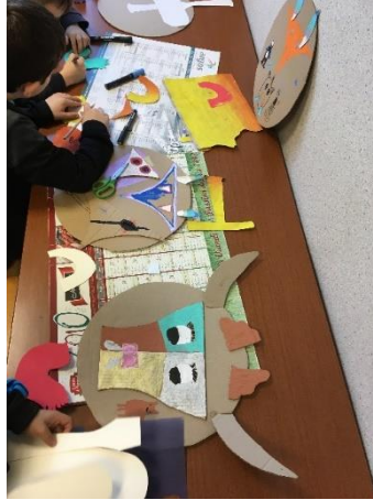
Art de la récup'