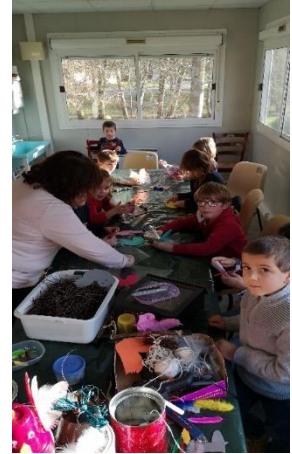
Autour des oiseaux